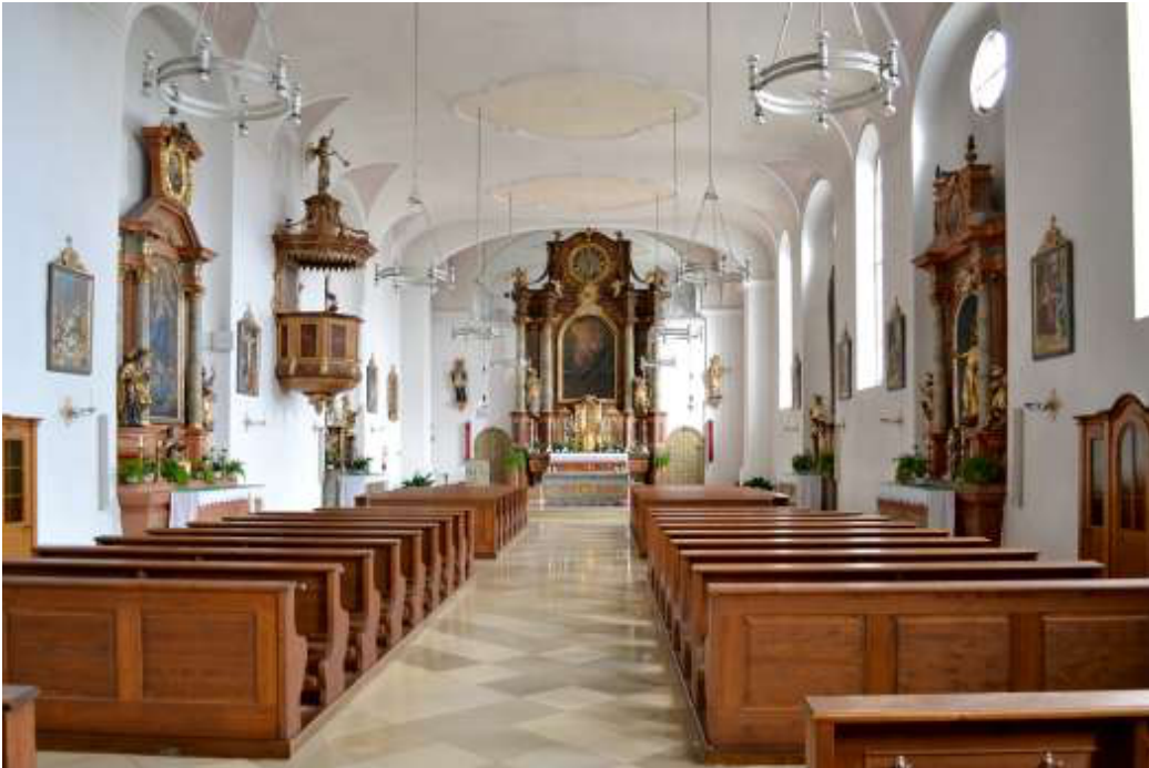
Die Klosterkirche (innen)