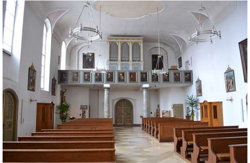
Die Klosterkirche (innen)