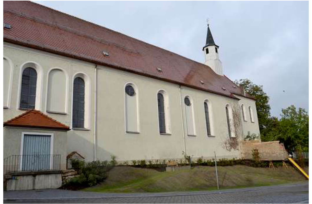
Die Klosterkirche (außen)